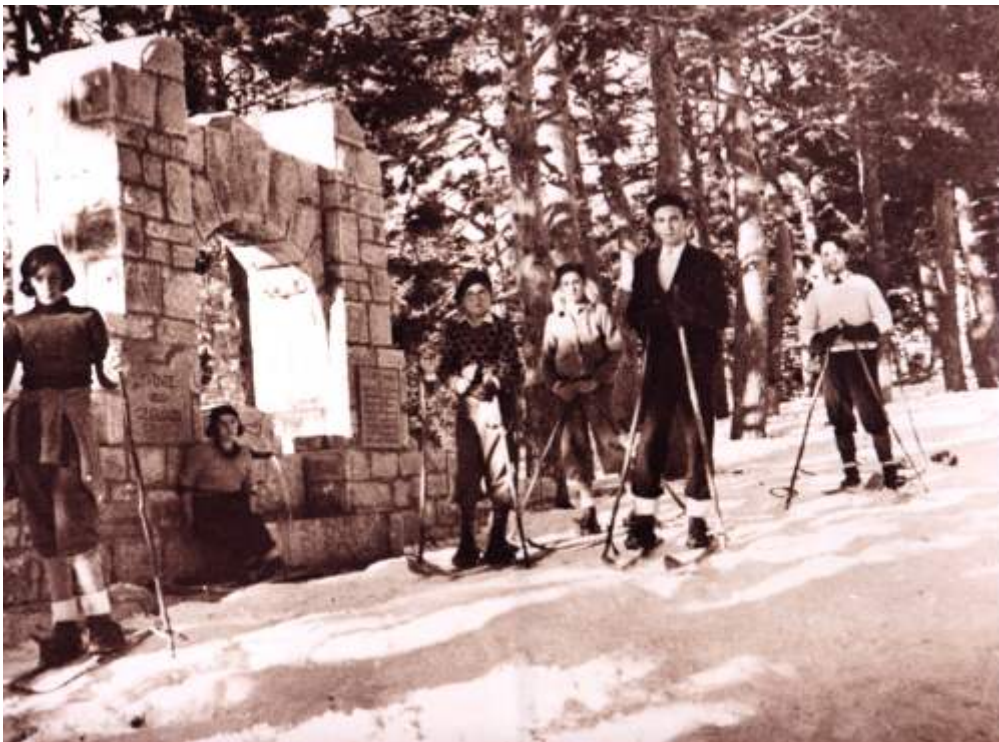
Alumnos en la Fuente de los Geólogos en 1933 -Sierra de Guadarrama- - Cercedilla