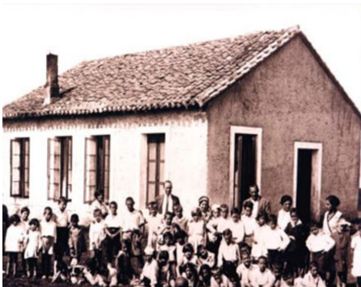
Alumnos en La Colonia agosto 1930