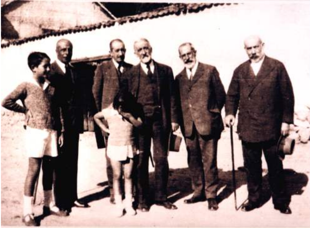
Profesores y alumnos en una excursión (1930)