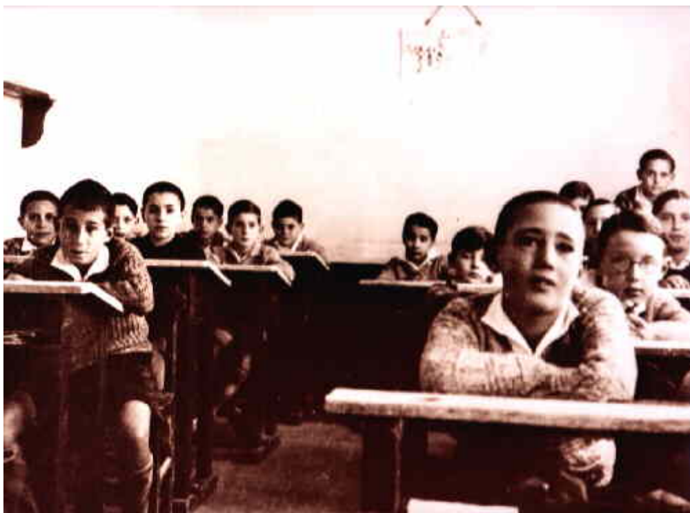
Alumnos en la clase de la Institución 1930