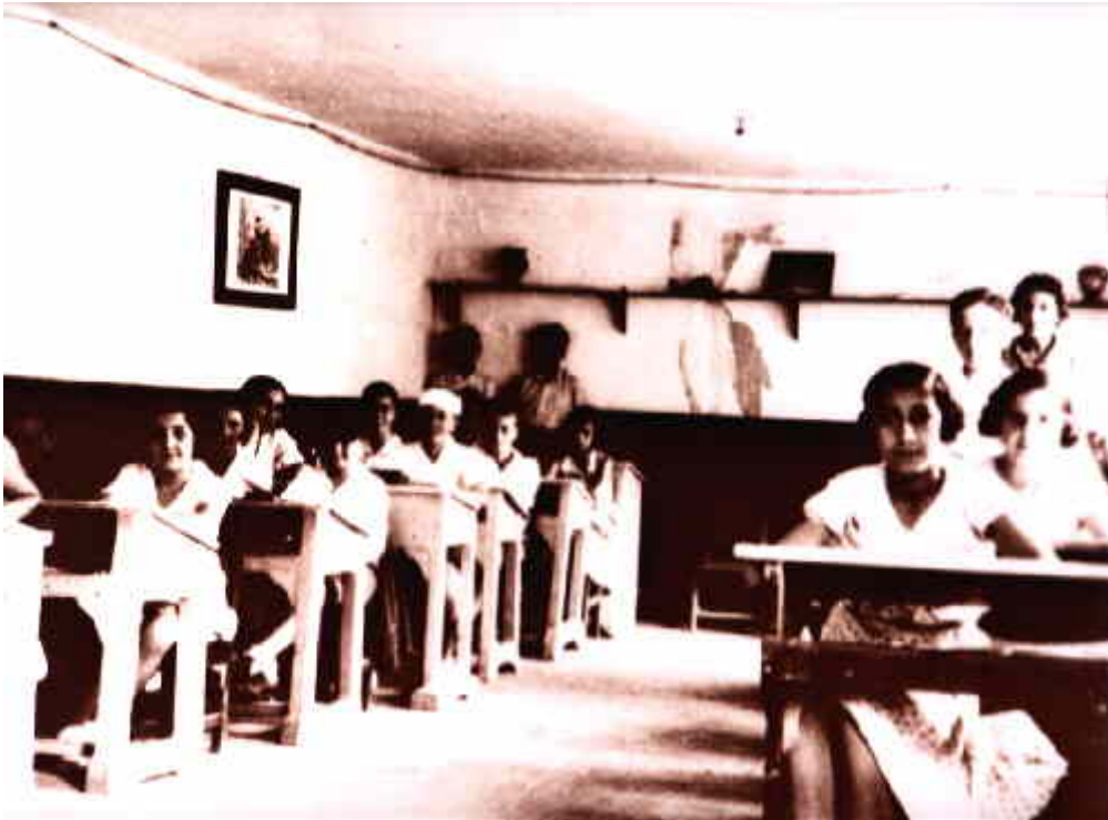
Alumnos en la clase de la Institución 1930