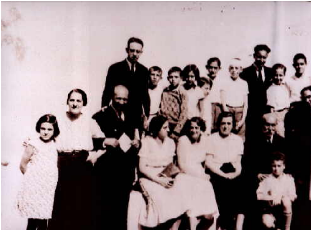
Profesores y alumnos en el frontón de la ILE