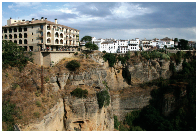
Bellísima panorámica de una parte de la ciudad

Desde las estaciones de autobuses de diversos puntos de la Costa del Sol, como Málaga, Torremolinos, Fuengirola, Benalmádena Costa, Marbella y San Pedro de Alcántara también se puede llegar.