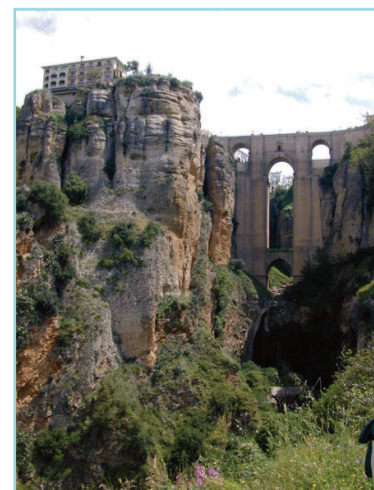
Vista del espectacular Tajo de Ronda desde su base

Numerosos son los intelectuales que la han vivido: figuras del cine, escritores, poetas y filósofos, políticos, toreros... Es una ciudad para que cualquiera venga a visitarla y no pueda evitar sentirse atrapado, y quiera volver.